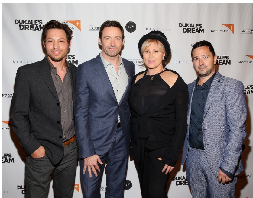
Title - Premiere di Dukale's Dream